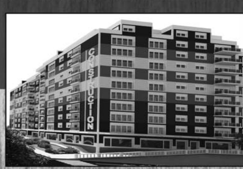
Kompleksi Derin Residence Lagjja Muhaxhuret

"Ukrayna'daki savaş bölge ülkeleri için de zorlukları artırdı. Batı Balkanlar'dan ilginin uzaklaşması, üçüncü aktörlerin her alandan istifade etmesine neden olabilir ve ülke ile bölgenin entegrasyon süreçlerinin devamına olumsuz etki edebilir. Kosova ile Sırbistan arasındaki ihtilafın çözümü için verilen Fransız-Alman ve ya Alman-Fransız taahhüdü ve teklifini ya da Brüksel teklifini değerli buluyor, diyalogun devam etmesini destekliyoruz." (AA)