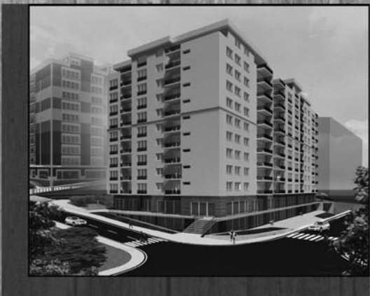
Kompleksi Breznica Residence Lagjja Muhaxhuret