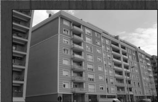
Kompleksi Trio Construction Lagjja Kalabri