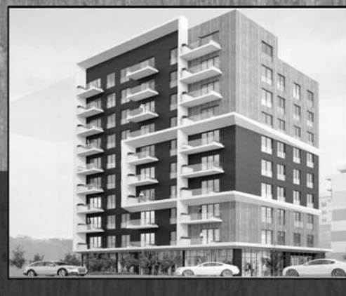
Objekti Corner Hill Lagjja Muhaxhuret