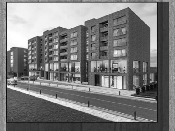
Kompleksi Trio Center Lagjja Prishtina e Re

ADRES: RR. LORDI BAJRON BLOK 2, KAT 1 DAİRE 3 MAHALLA E MUHAXHEREVE PRISHTINA İLETİŞİM: +383 44 405 851