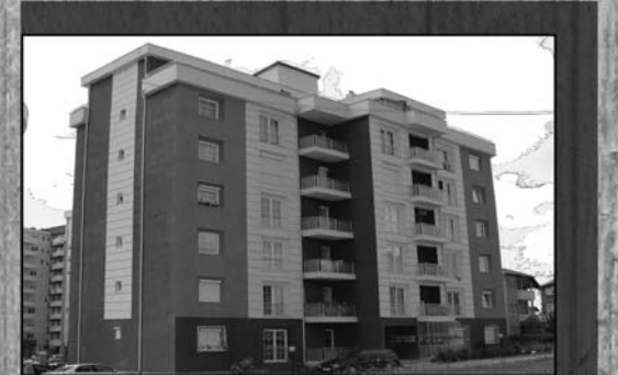
Objekti Trio Construction Lagjja Mati 1